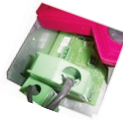
Ventouse + simples contacts