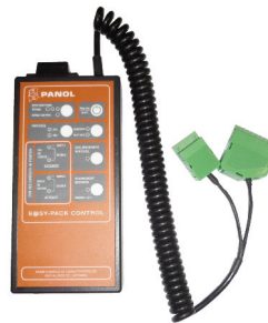
E@SY PACK CONTROL