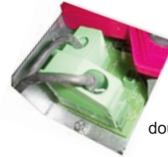
Ventouse + doubles contacts